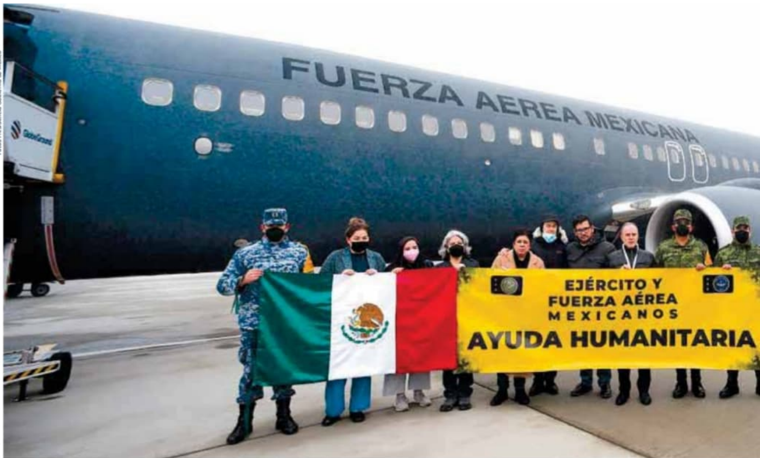
Las Fuerzas Armadas cumplen con eficacia la misión de rescate.