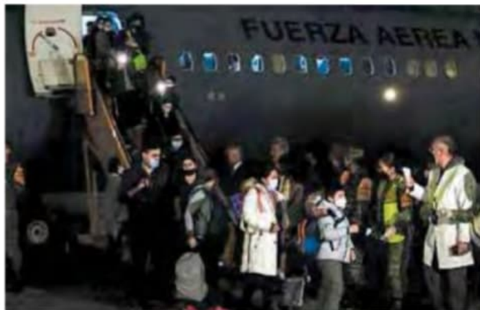
Regresan sanos y salvos.

La embajadora Olga García Guillén informó que se tenían registrados 225 mexicanos en Ucrania, la gran mayoría de ellos en la capital.