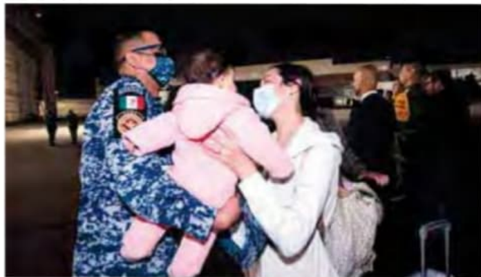
Salida exitosa en medio del conflicto.