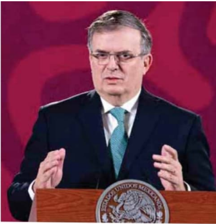
Ebrard | Condena energética a la invasión.